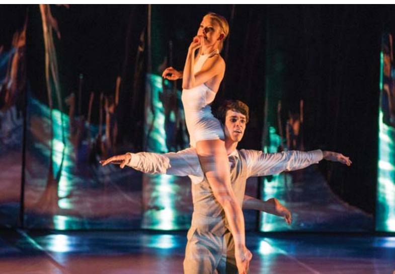
Black and White