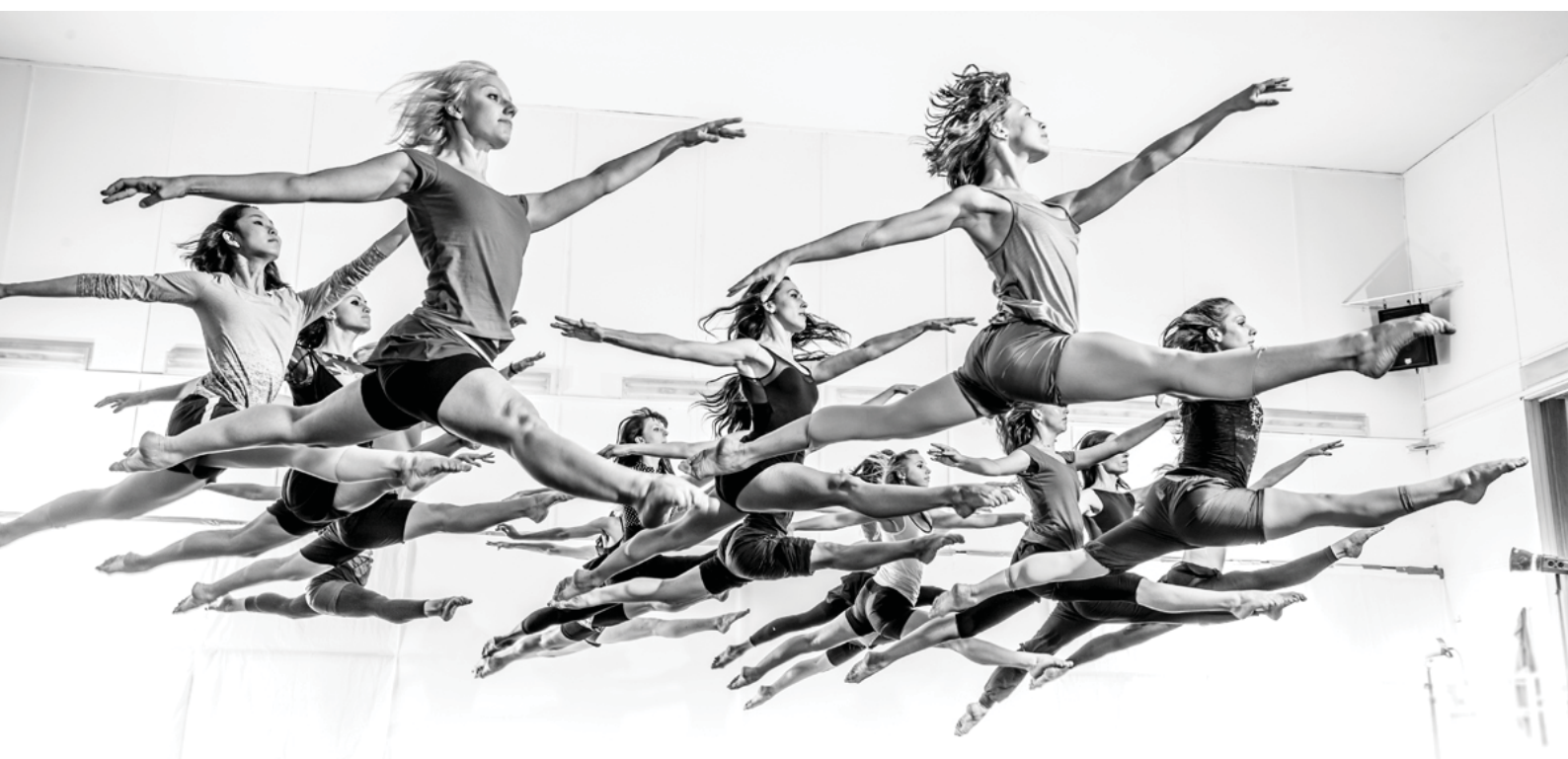
Originální foto Black and White Benefice