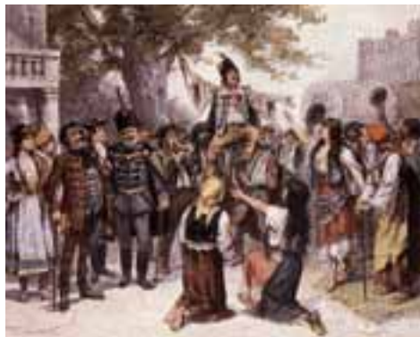
Dobový obrázek z operety Cikánský baron