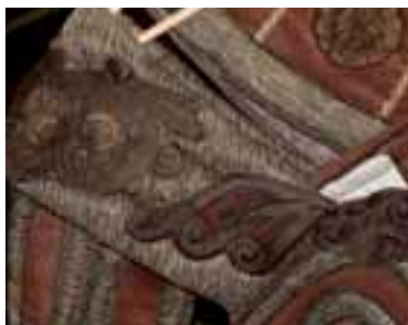
Následně v pánské krejčovně přišivali nebo lepili jednotlivé ozdoby.