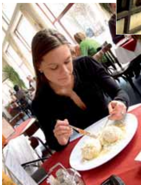
▲ Něco po jedné se herečka dostává k obědu. I při tak intimní činnosti jsme ji mohli vyfotit.