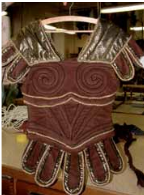
Takto vypadalo brnění po ušití.

„Kostýmy ve Spartakovi jsou stylizací římského oděvu s respektem k pohybu,“ říká výtvarník, „vojáci mají být oděni do těžkého brnění. Vzhledově brnění tomuto požadavku odpovídá. Při výrobě jsou ale použity měkké materiály, aby kostým nebránil v pohybu.“