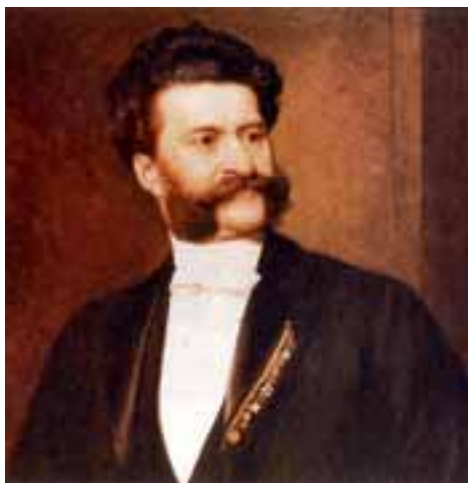
Johann Strauss mladší

díle. V Divadle na Vídeňce se v únoru 1871 uskutečnila premiéra první Straussový operety pod názvem Indigo a čtyřicet loupežníků. Záhy následovala další díla – Karneval v Římě, jeden z vrcholů Straussový tvorby Netopýr, Cagliostro, nepřítel úspěšný Princ Metuzalém, Královnin krajkový šátek, Veselá vojna a Noc v Benátkách. Na jaře 1883 dirigoval Strauss v maďarské Pešti reprízu své Veselé vojny. Jeho třetí žena Adéla ho přiměla, aby navštívil spisovatele Móra Jókai a získal od něj látku na