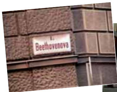
▲ Zuzka zahájila den na této ulici.