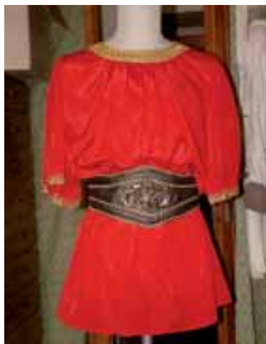
Šat pod brnění.