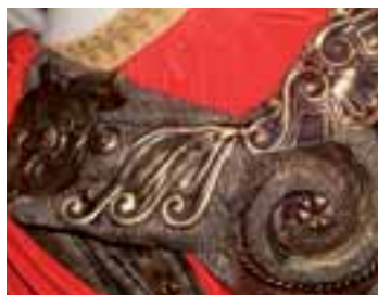
Po jejich aplikaci na brnění, viz již uvedené foto, ve výrobě rekvizit každou ozdobu museli nabarvit. Takže se v dílnách a krejčovnách šilo, peklo, lepilo, barvilo.