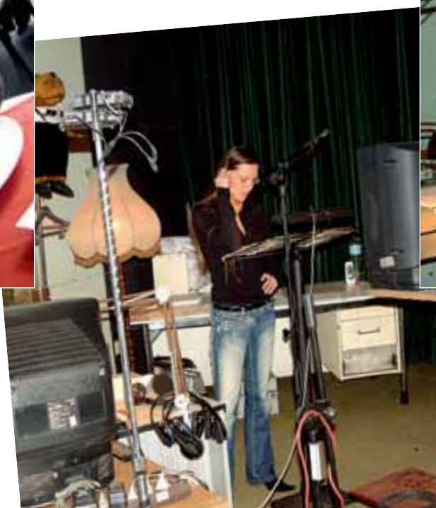
Odpoledne práce v dabingu. ►