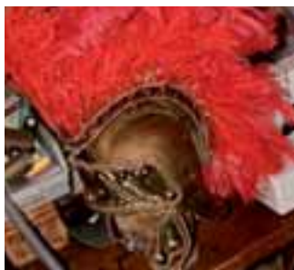
Pokryvka hlavy vojáka.