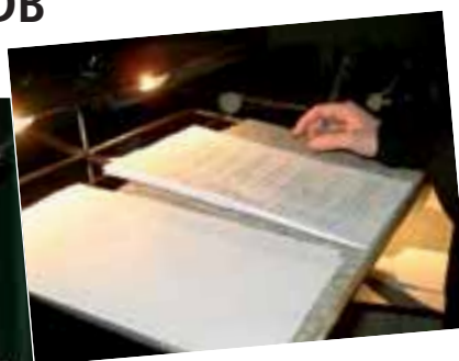
▲ Zuzčin text.