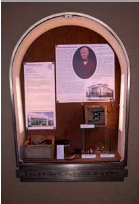
Vitrína Technického muzea v Mahenově divadle.