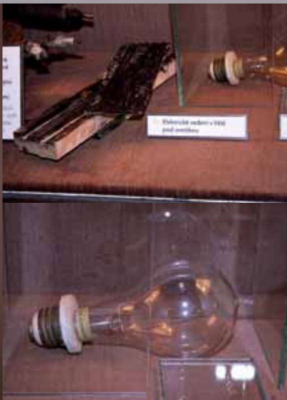
▲ El. vedení v liště pod omítkou. ▲ Žárovka T. A. Edisona.

objevují zprávy o „neštěstích“, někdy i se smrtelným zraněním.