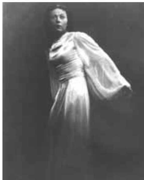
Zora Šemberová v roli Julie – 1938.

byla ve své době velmi moderní. Její taneční projev se značně lišil od běžných pravidel. V Praze spoluzaložila taneční konzervatoř. Patří k nejvýraznějším osobnostem českého tanečního umění.