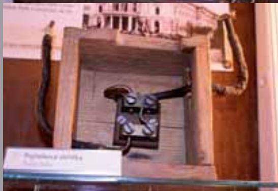
▲ Rozvodná pojistková skříň. ▲ Pojistková skříňka